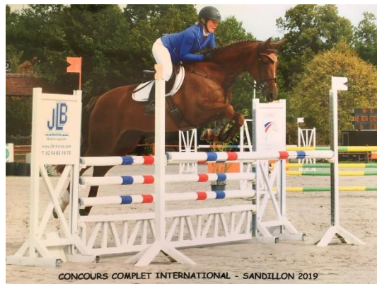
Une Pour Deux Sandillonin CCI1* - kisoissa 2019