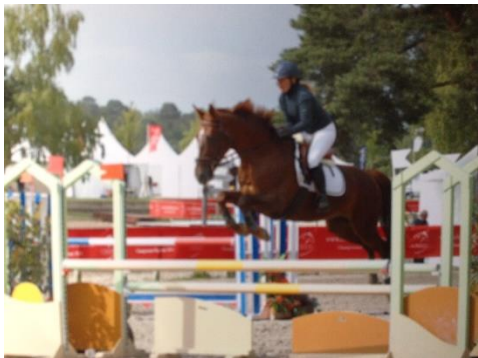
Quadrille Pariisin mestaruuskisoissa 2014